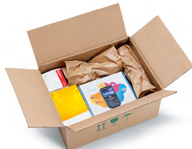
Papier de calage