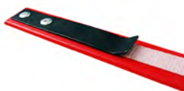
Aiguille pour passage feuillard sous palette