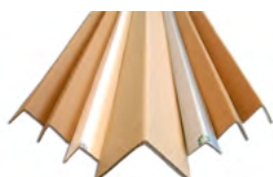
Cornière de protection