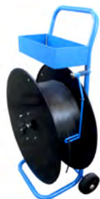
Dévidoir feuillard PET/PP