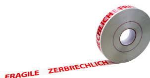
Ruban adhésif personnalisé