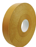
Ruban kraft adhésif solvant