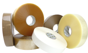
Ruban adhésif machine Qualité : hotmelt, PVC ou solvant